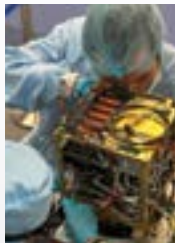
IRIDE lavori in corso presso la CR di OHB Italia

sintetica), sensori di tipo iperspettrale, payload ottici con risoluzioni di due o tre metri (in alcuni casi anche inferiori al metro), il tutto a bordo di satelliti di diverse tipologie e dimensioni, di matrice esclusivamente italiana.